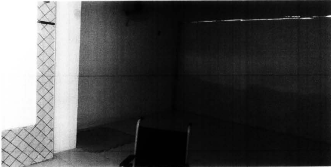
Sala de Pilates