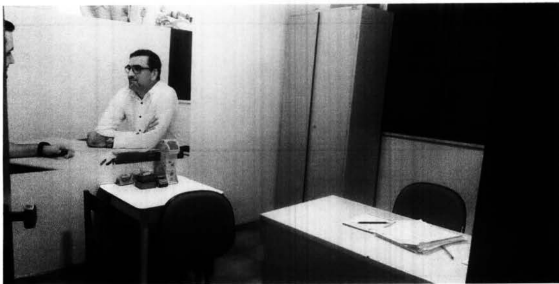
Sala de Atendimento