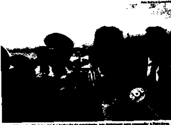
General Joaquim Silva e Luna é o indicado do presidente Jair Bolsonaro para comandar a Petrobras.

Bolsonaro afirmou que o novo nome para o cargo de presidente da Petrobras é o general Joaquim Silva e Luna.