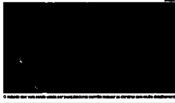
O método que usa satélite para mapear clareiras em florestas ajuda a determinar com mais detalhamento

O método utiliza um avião que lança milhares de feixes de laser, que acertam a superfície da terra. O método utiliza, a tecnologia de laser e a degradação da vegetação para mapear as clareiras de florestas, segundo estudo publicado na Scientific Reports.