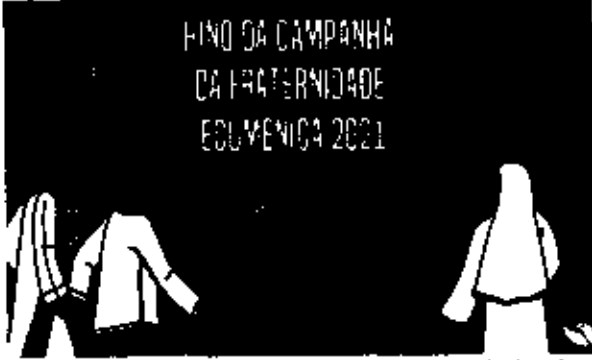
Cartaz da Campanha da Fraternidade, com o tema "Fraternidade e Diálogo: compromisso de amor"

A conferência regional acontece no dia 17 em São Luís e acontece em todo o país. O lançamento ocorre uma