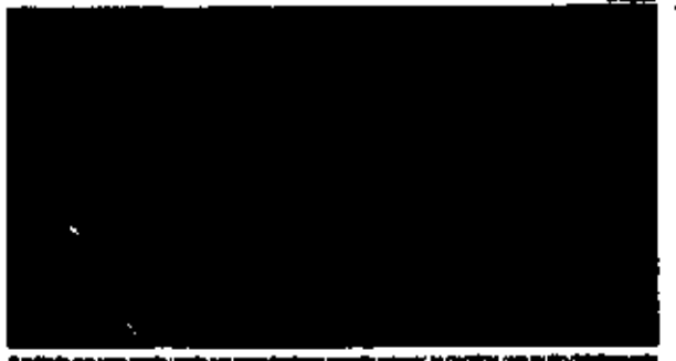
O método que vem sendo usado por pesquisadores para mapear as clareiras com o uso de lasers

A técnica consiste em lançar de um avião milhares de feixes de laser, que acionam a superfície da terra, criando um mapa 3D das clareiras.