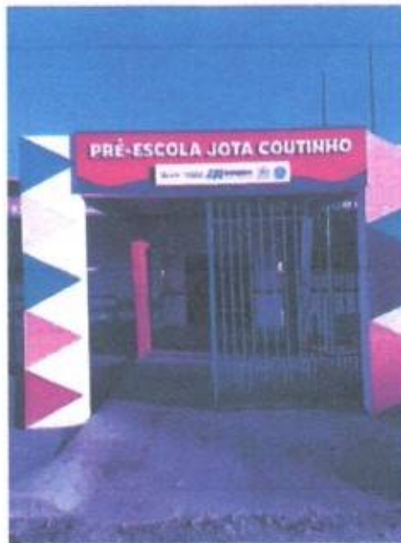
Imagem 2 – Placa em ACM

Relatório fotográfico de medição de aditivo realizada "in loco" na Pré-Escola Jota Coutinho, localizado na Av. Raimundo Almeida, SN, Residencial José de Sousa Almeida, Chapadinda - MA, 65500-000.