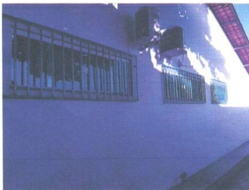
Imagem 8 - Grades e janelas de vidro

Fis 1445 Proc. Nº 0316/21 Ass [Signature]