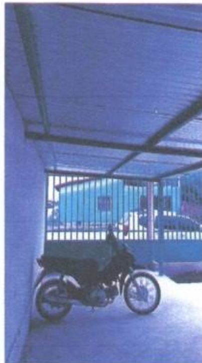
Imagem 12- Estacionamento para motos

Lucas de Barros Monteleza Engenheiro civil CREA-MA 111983915-7