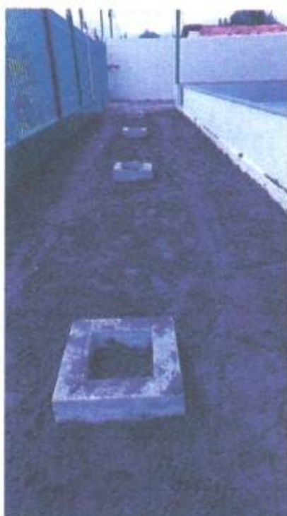
Imagem 12- Área Para implantação de grama

Lucas de Barros Monteles Engenheiro civil CREA-MA 111983915-7