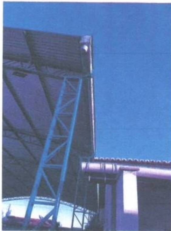
Imagem 4 – Calha em Aço

Lucas de Barros Monteles Engenheiro civil CREA-MA 111983915-7