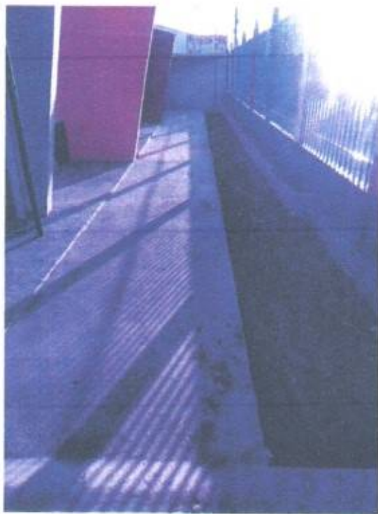
Imagem 12- calçada em concreto