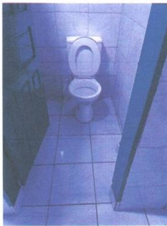
Imagem 12- Vaso

Lucas de Barros Monteles Engenheiro civil CREA-MA 111983915-7