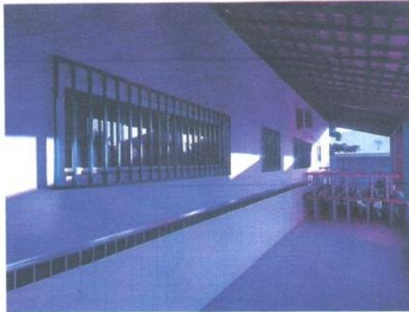
Imagem 9 – Grades e janelas de vidro