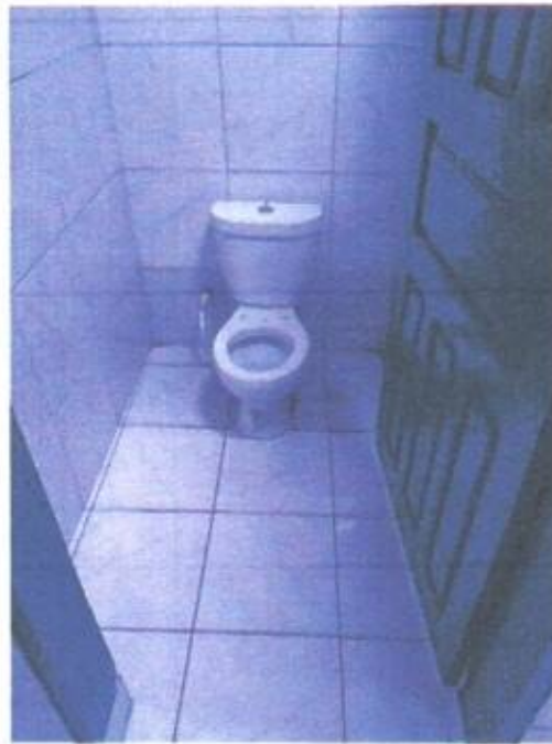
Imagem 11 – Vaso infantil