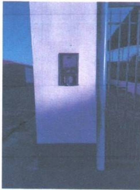
Imagem 3 – Caixa para medidor