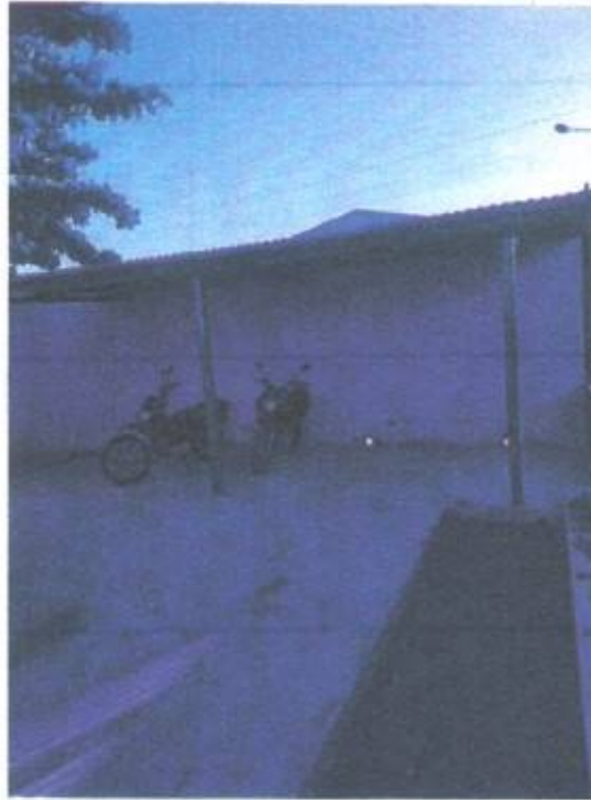
Imagem 12- estacionamento para motos