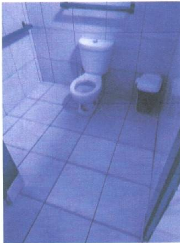
Imagem 10 – Vaso infantil

Lucas de Barros Montetes Engenheiro civil CREA-MA 111983915-7