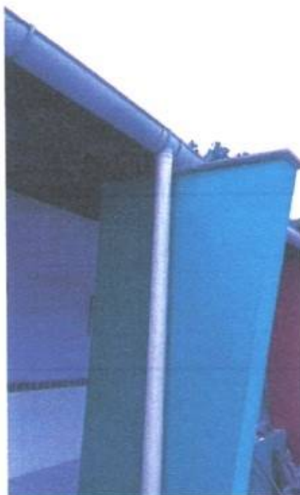
Imagem 5 – Calha em pvc