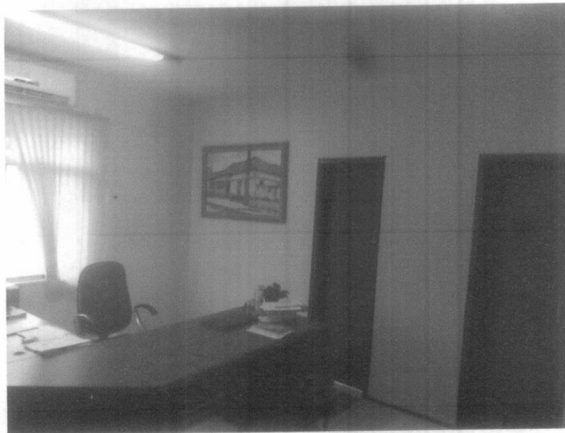
Sala da Secretária