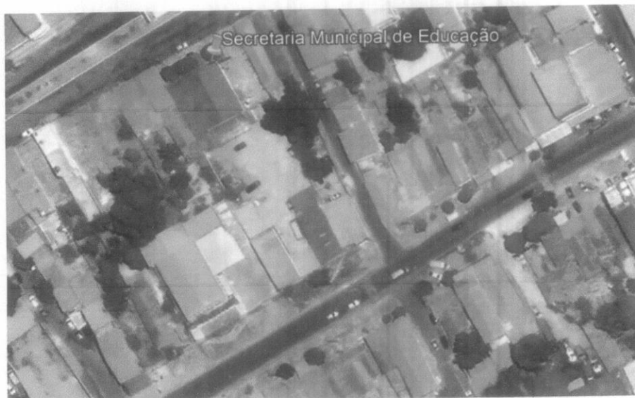
Amostra 1 – Secretaria Municipal de Educação

Latitude: 3°44'38.55"S Longitude: 43°21'52.19"O