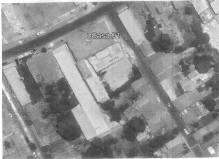
Amostra 2 – Imóvel situada na Av. Ataliba Vieira de Almeida

Latitude: 3°44'47.02"S Longitude: 43°21'59.80"O