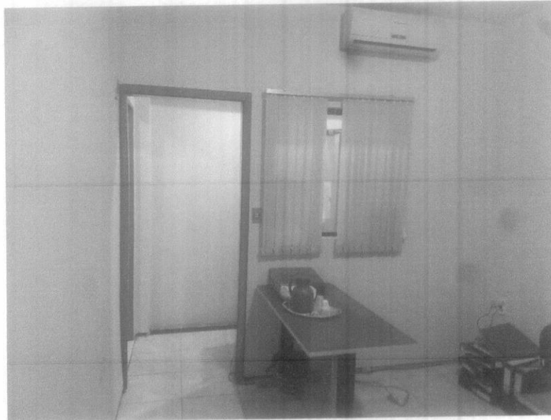
Sala 01