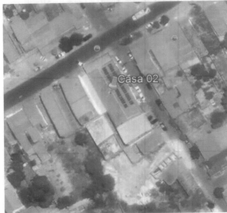
Amostra 3 – Residência situada na Av. Ataliba Vieira de Almeida

Latitude: 3°44'45.42"S Longitude: 43°21'56.56"O