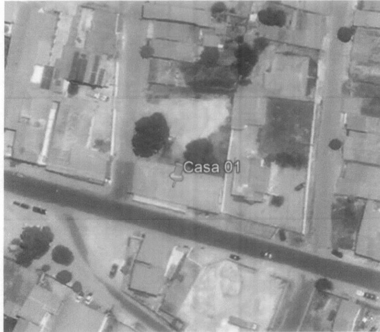
Amostra 2 – Residência situada na Av. Ataliba Vieira de Almeida

Latitude: 3°44'43.44"S Longitude: 43°20'50.12"O