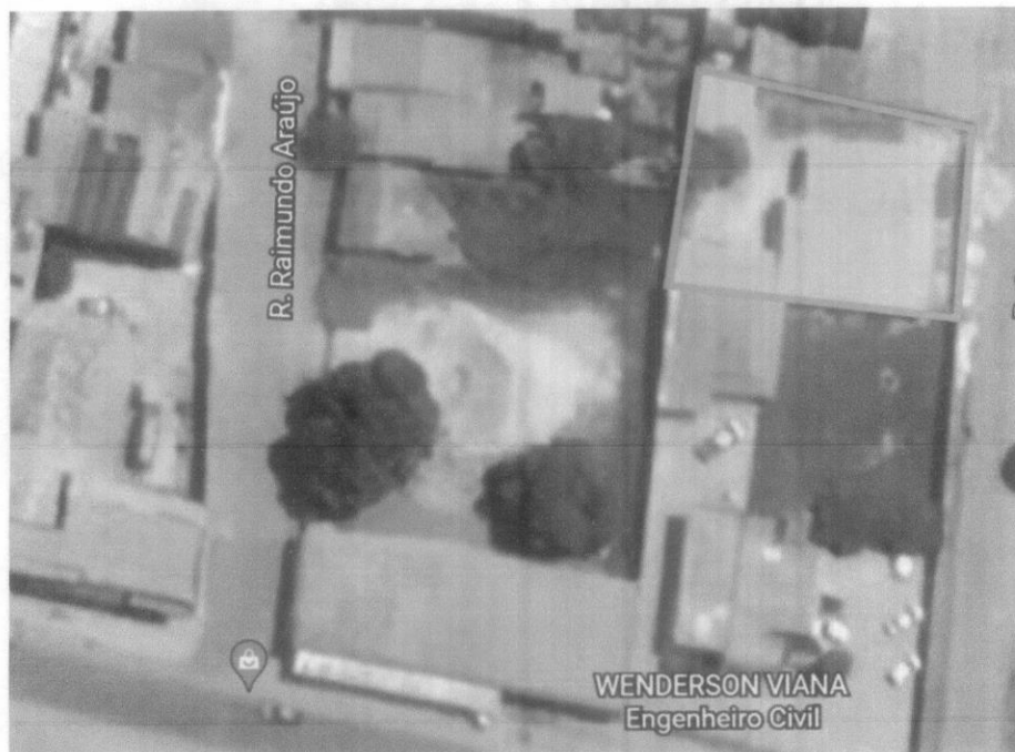
Amostra 1 – Secretaria Municipal de Agricultura e Abastecimento