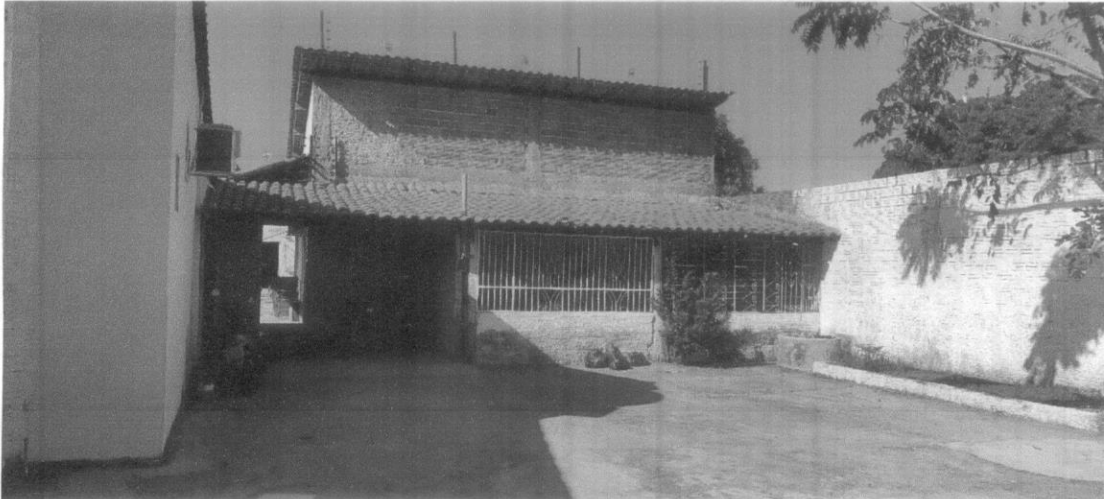
Pátio externo