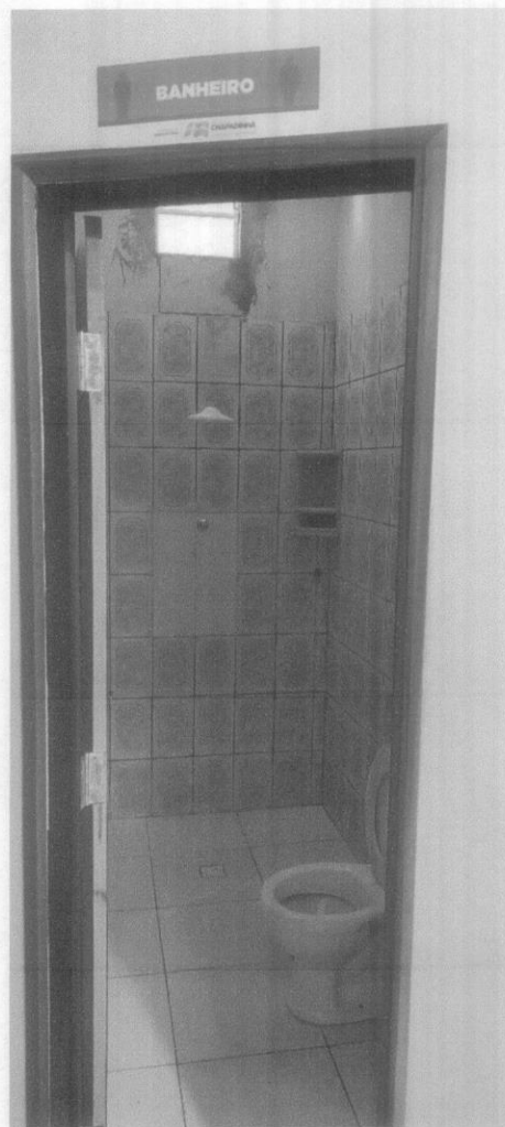
Banheiro 01