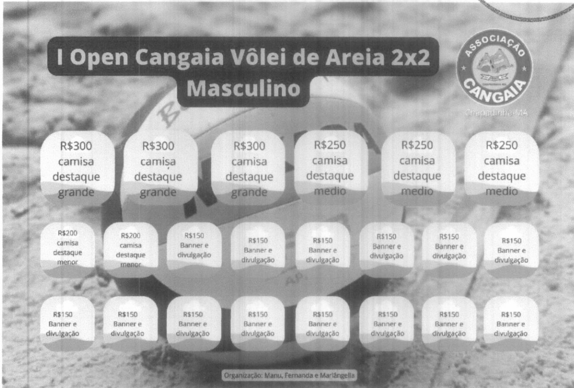
Croqui dos Patrocinadores no Banner (Imagem 1)

Fis. 018 Proc. Nº 012/2022 Ass. [Signature]