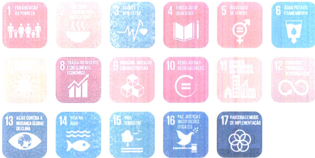
Figura 03. Os 17 Objetivos de Desenvolvimento Sustentável

Em fortalecimento aos compromissos firmados pelo governo federal junto a ONU que fazem parte dos Objetivos de Desenvolvimento Sustentável – ODS, articulados através da agenda 2030, este projeto proíbe a utilização de estratégias para construção de edificações sustentáveis, como forma de garantir sua resiliência e adaptabilidade em meio às mudanças climáticas. Sendo assim, o projeto envolve a utilização de sistemas construtivos e materiais capazes de contribuir para a preservação e conservação do meio ambiente, diminuindo o uso e o esgotamento dos recursos naturais, a produção de resíduos e o consumo de energia.