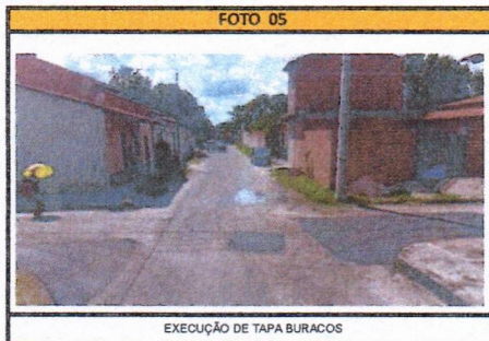
EXECUÇÃO DE TAPA BURACOS