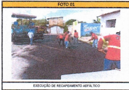
EXECUÇÃO DE RECAPEAMENTO ASFÁLTICO