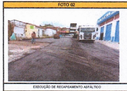
EXECUÇÃO DE RECAPEAMENTO ASFÁLTICO