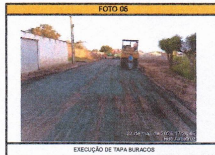
EXECUÇÃO DE TAPA BURACOS