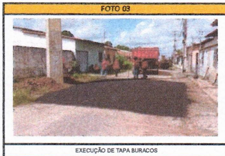
EXECUÇÃO DE TAPA BURACOS