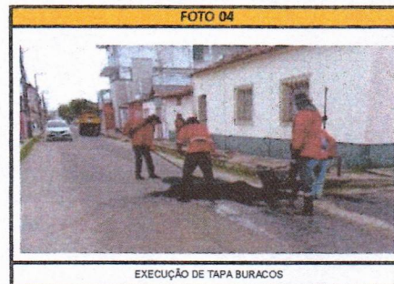
EXECUÇÃO DE TAPA BURACOS