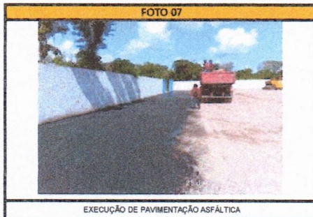
EXECUÇÃO DE PAVIMENTAÇÃO ASFÁLTICA