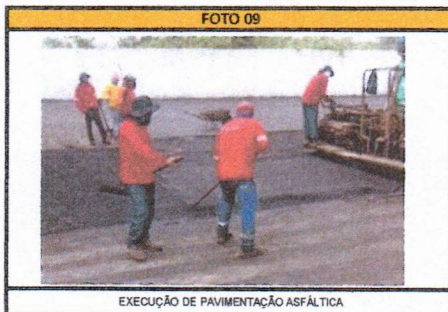
EXECUÇÃO DE PAVIMENTAÇÃO ASFÁLTICA