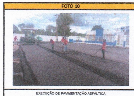
EXECUÇÃO DE PAVIMENTAÇÃO ASFÁLTICA