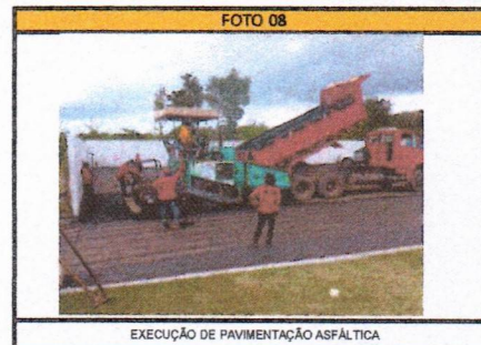
EXECUÇÃO DE PAVIMENTAÇÃO ASFÁLTICA