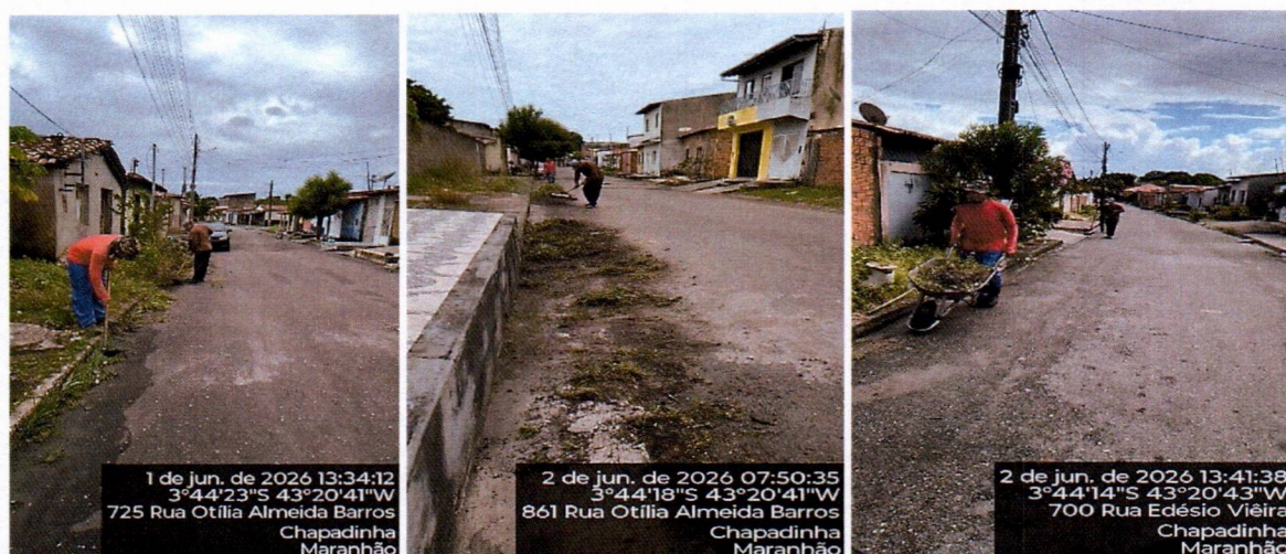
Imagem 05 – equipe realizando limpeza de ruas (varrição e remoção de entulhos), limpeza manual de vegetação em vias públicas e bota fora.