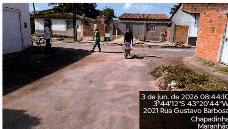
Imagem 01 – equipe realizando limpeza de ruas (varrição e remoção de entulhos), limpeza manual de vegetação com roçadeira em vias públicas e bota fora em caminhão basculante