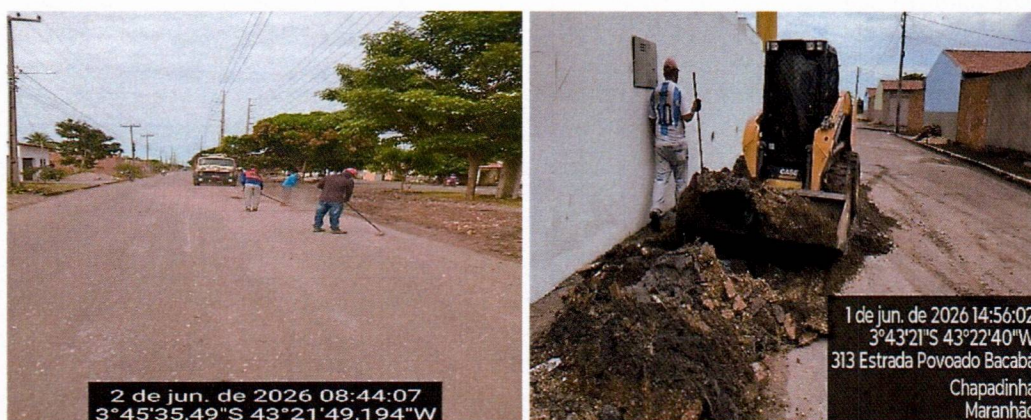
Imagem 04 – equipe realizando limpeza de ruas (varrição e remoção de entulhos), limpeza de vegetação em vias públicas e bota fora.