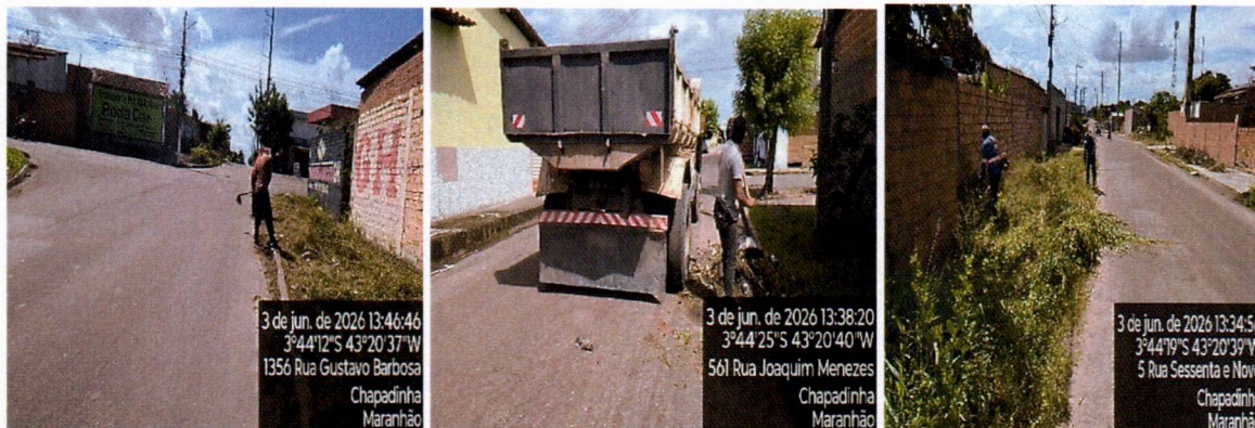
Imagem 03 – equipe realizando limpeza de ruas (varrição e remoção de entulhos), limpeza mecânica com roçadeira em vias públicas.